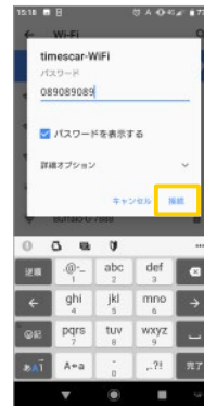
入力後「接続」をタッチ