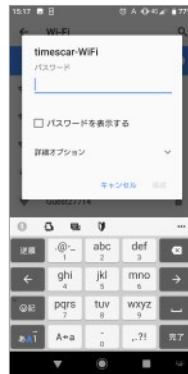
パスワードを入力